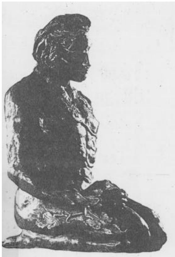
Une des œuvres de Danielle Bigata

Danielle Bigata expose ses sculptures récentes à compter d'aujourd'hui, galerie des Carmes